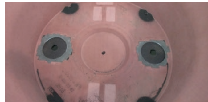
NETCore® Formen vor dem Gießen (Oberkasten)

Durch die Verwendung der NETCore® Technologie kann das Gussteil mit geringerem Aufwand durch die Putzerei geschleust werden. Dies ermöglicht es der Gießerei, die Bearbeitungszeit um 30 Minuten/Gussteil oder 98 % zu reduzieren. Das Entfernen des Speiserrestes ist durch mechanische Maßnahmen möglich. Zusätzlich wurde das Ausschussrisiko durch ein Hereinbrechen eliminiert.