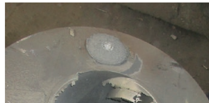
NETCore® Gussstück vor Putzvorgang (Speiserrest abgeschlagen)