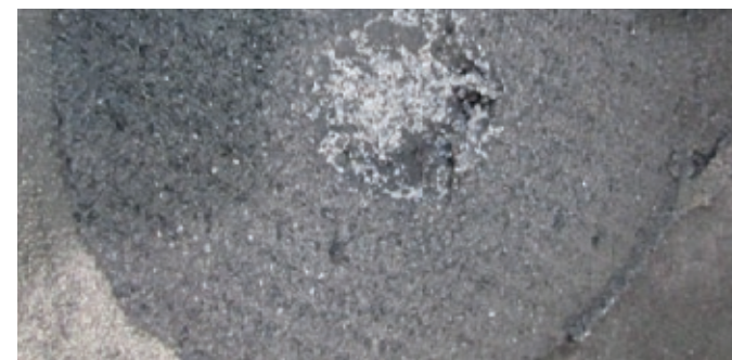
NETCore® Trennfläche Speiserrest